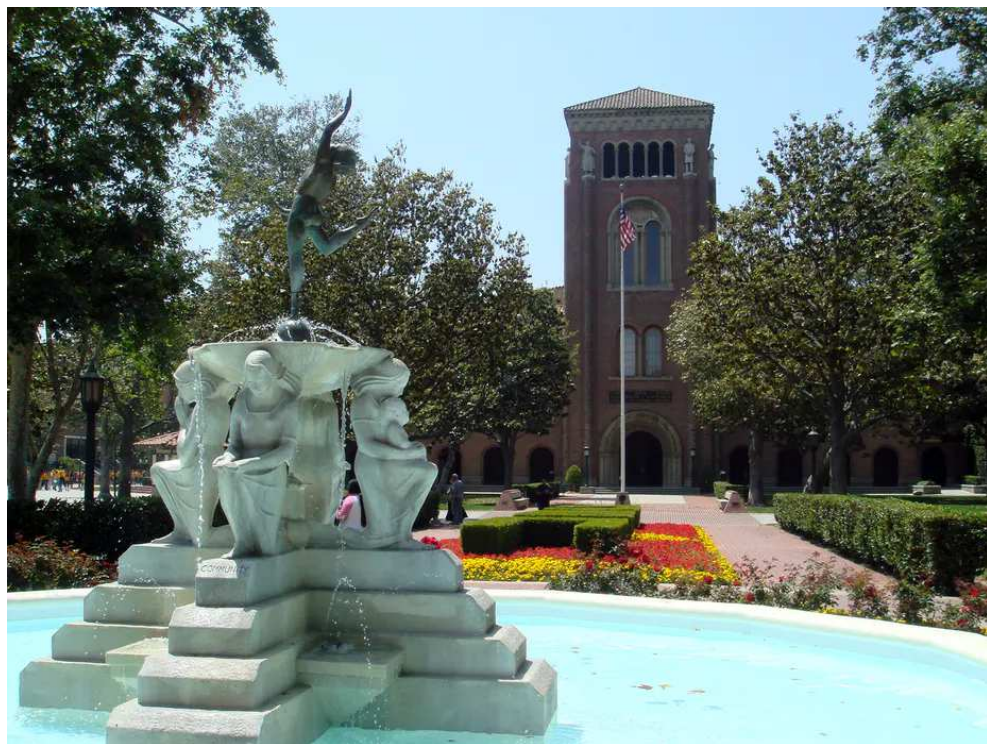
L'université de Californie du Sud, à Los Angeles.