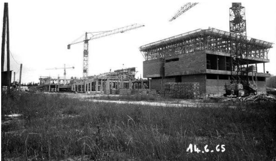
Construction de l'école national de santé publique (1965) maintenant sous l'appellation Ecole des hautes études en santé publique (EHESP).